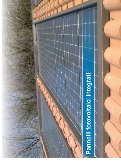
Pannelli fotovoltaici integrati

desidero ricevere ulteriori informazioni per aderire al Progetto Centrale Fotovoltaica a Berzo S. Fermo