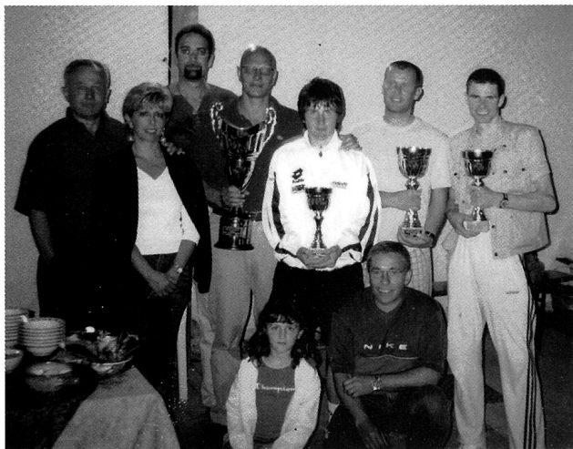
PREMIAZIONI DEL TORNEO DI TENNIS SINGOLO VALCAVALLINA 2003

Anche quest'anno numerose sono le iniziative che ci accompagnano durante l'estate.