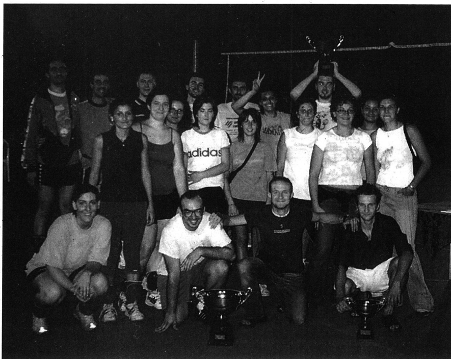
Premiazioni del torneo di pallavolo - luglio 2003