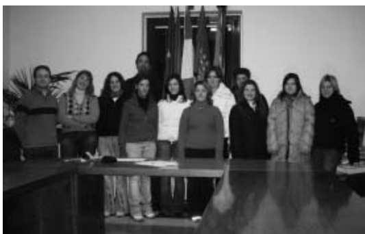
Premiazione anno scolastico 2004/2005