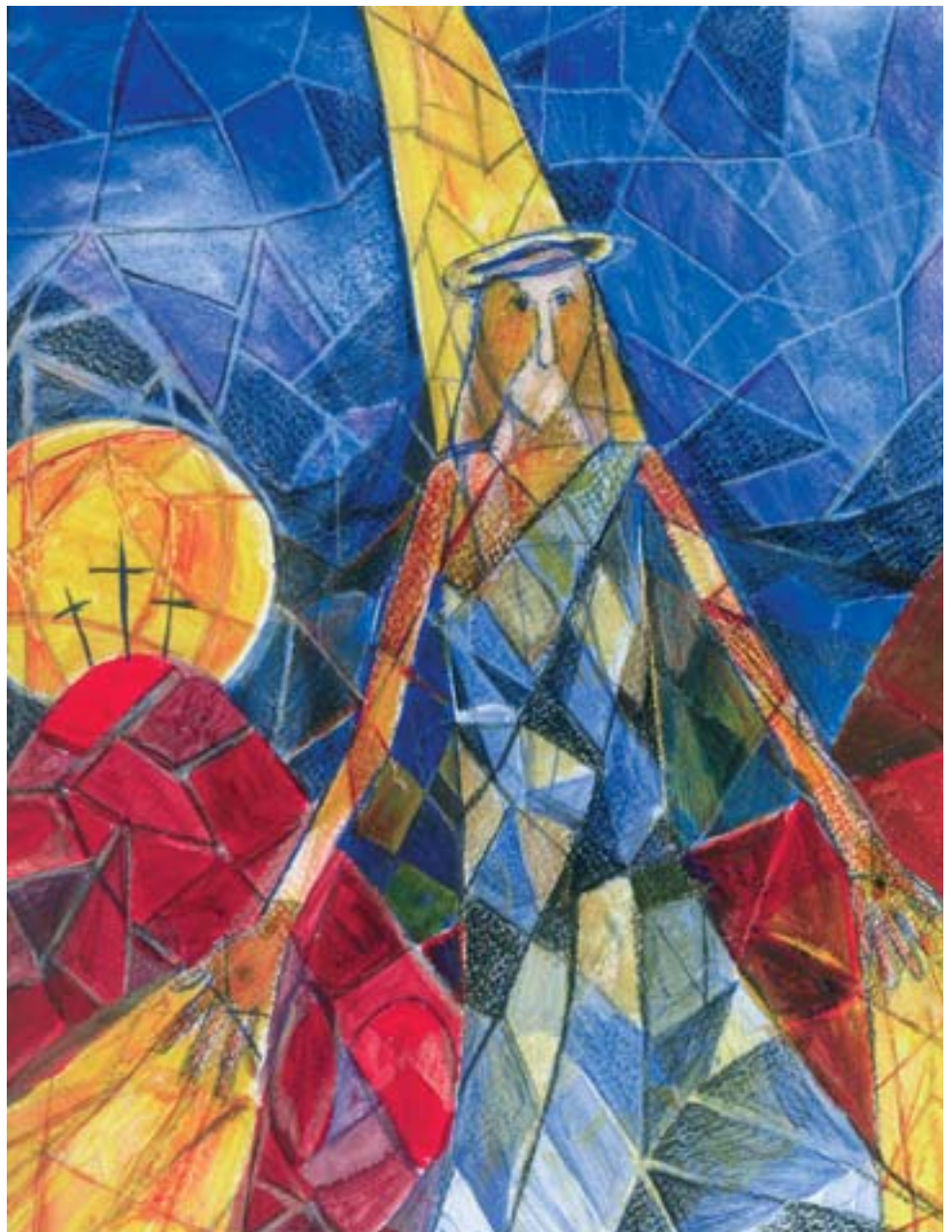
Disegno di Rossella Vaerini