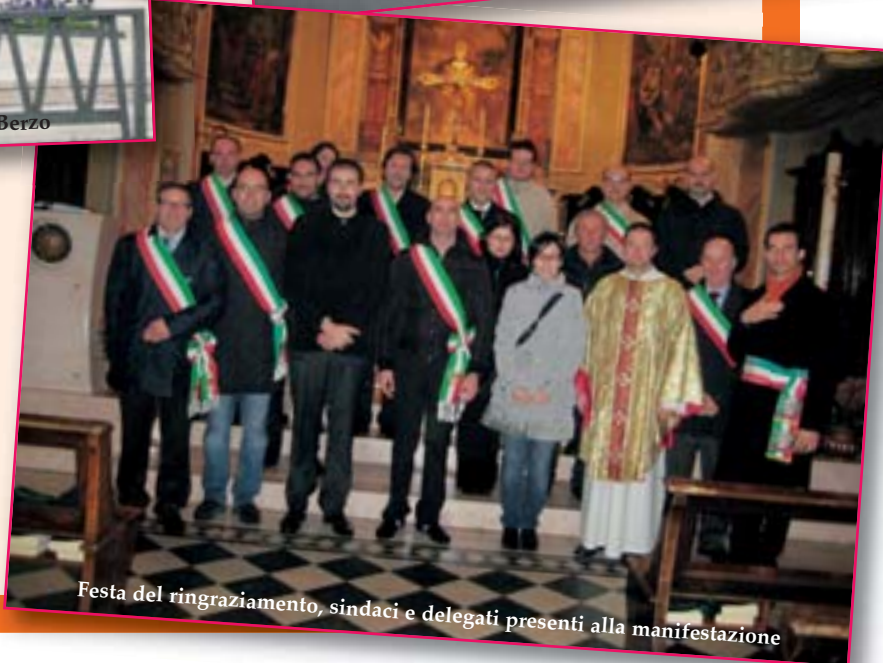
Festa del ringraziamento, sindaci e delegati presenti alla manifestazione