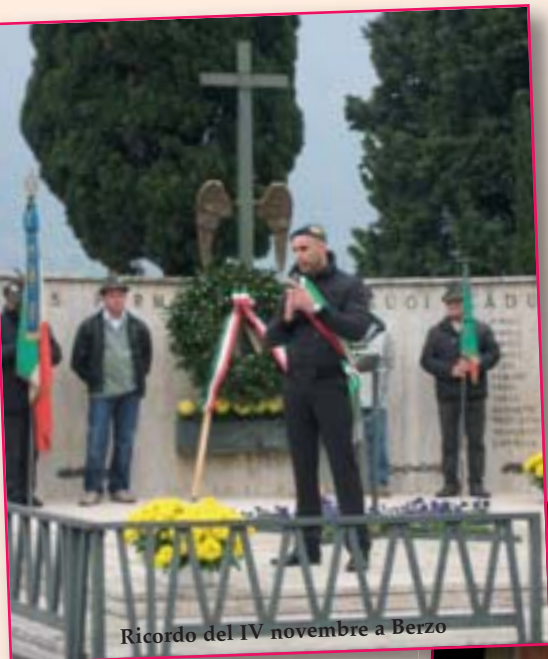
Ricordo del IV novembre a Berzo