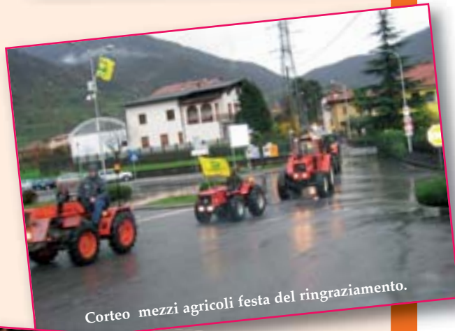
Corteo mezzi agricoli festa del ringraziamento.