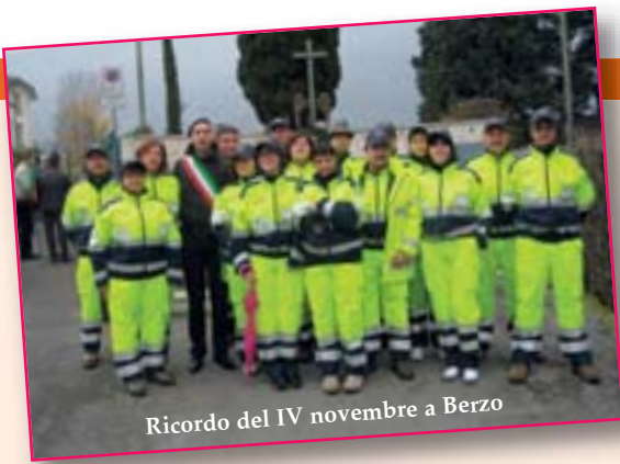
Ricordo del IV novembre a Berzo