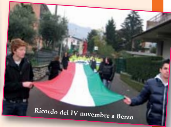
Ricordo del IV novembre a Berzo