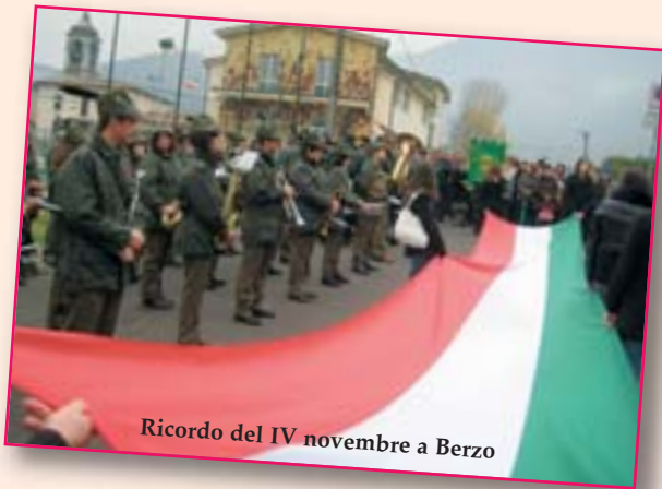
Ricordo del IV novembre a Berzo