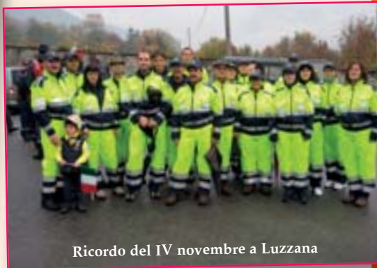
Ricordo del IV novembre a Luzzana