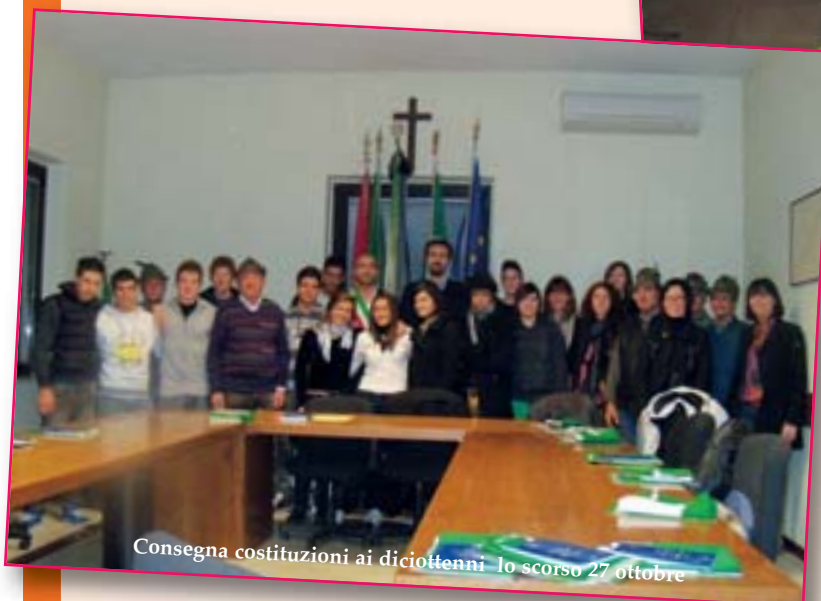
Consegna costituzioni ai diciottenni lo scorso 27 ottobre