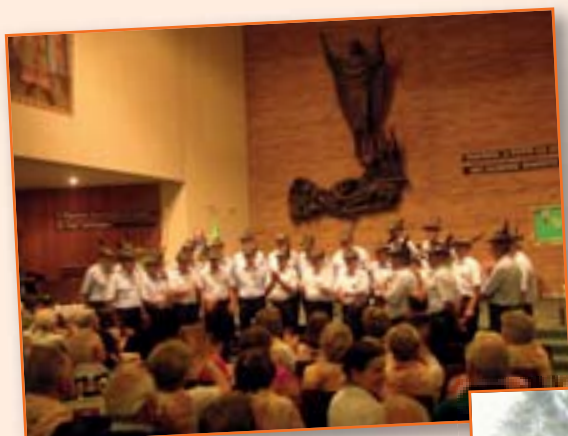
Adunata Nazionale Alpini a Bolzano Il Coro Valle Cavallina in concerto.