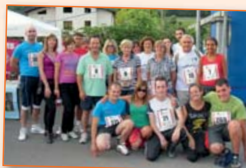
Camminata con gli Angeli Marcia non competitiva 18 luglio a Endine G.no