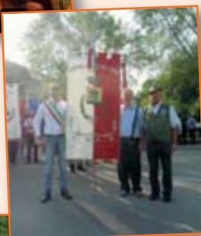
Adunata Sezionale Alpini di Bergamo a Martinengo