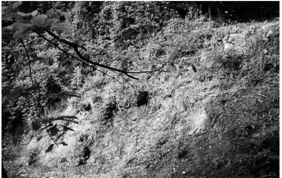
1ª pulizia fontanile Colle Pengiöl - maggio 2004